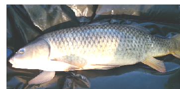
Die Siegerfische aus dem WW–Weiher

Oben: Der KÖNIGSKARPfen von Fabian KLEIN, geschätzt ca. 8 kg