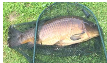
Große Fische aus dem WW-Weiher