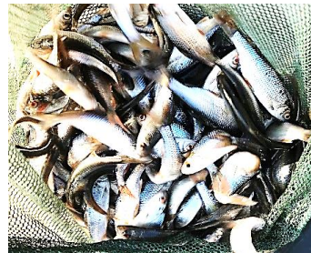
6.400 St Rotaugen+Rotfedern 8–10 cm und 50 kg Rotaugen über 20 cm