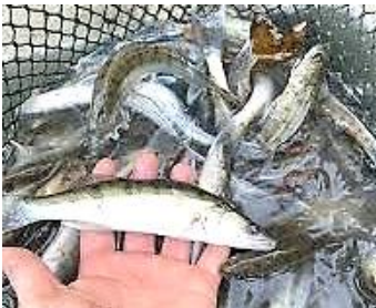
190 St Zander 20–25 cm